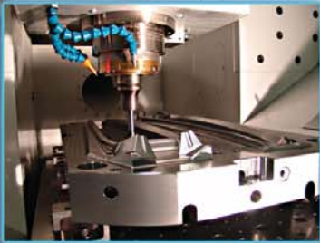
MAQUINADO ALTA VELOCIDAD/ALTA PRECISION