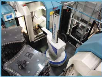
MOLDES AUTOMOTIZADOS CONSTRUCCION DE CELULAS