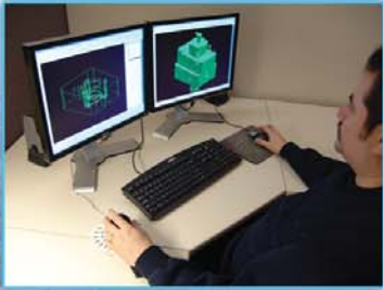
INGENIERIA Y DISEÑO